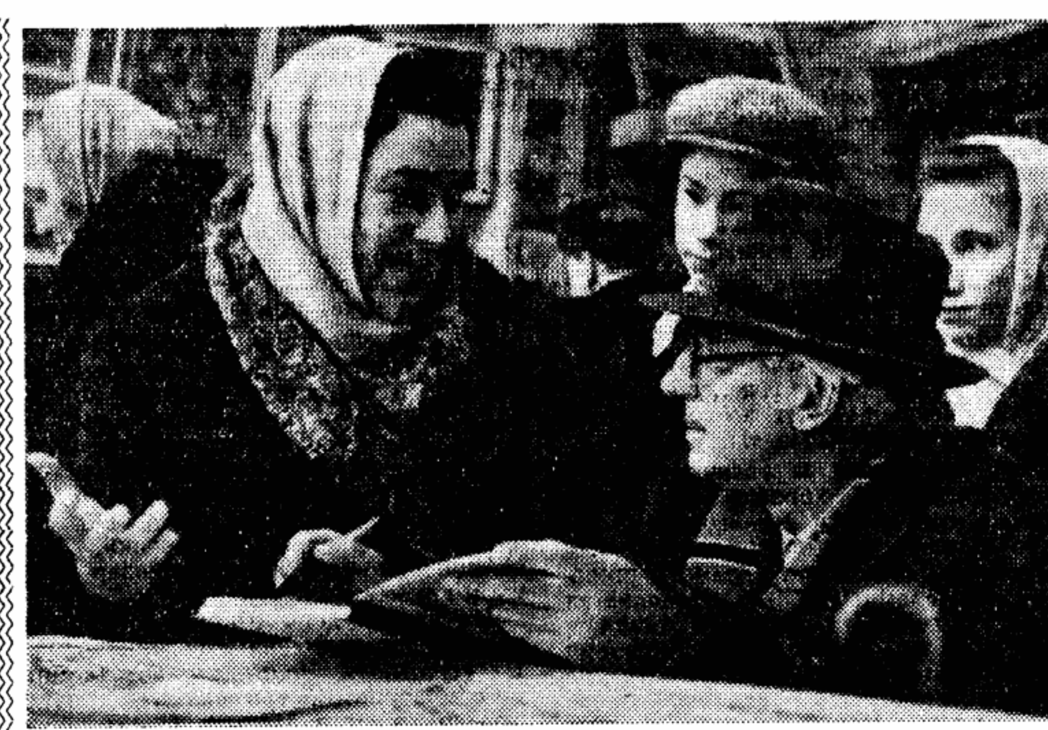
Он существует в Киеве с декабря прошлого года. Собственно говоря, клуба в обычном понимании этого слова нет. Но если вы зайдете в первое воскресенье любого месяца в книжный магазин № 9, вы сразу поймете, что это такое — клуб автора и покупателя.