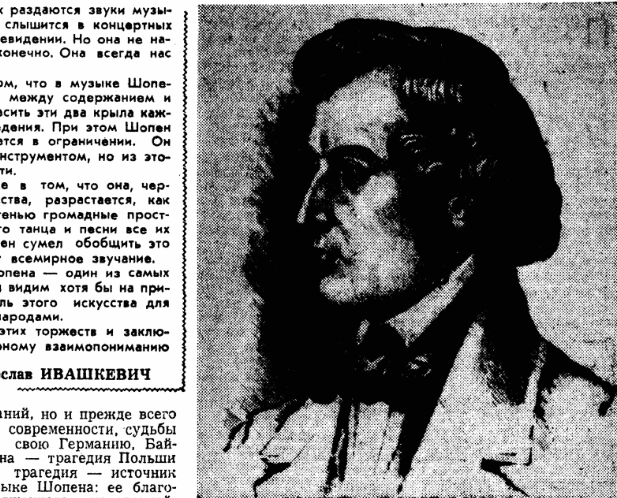
Рисунок А. Ильичева

Недавно в одной джакартской газете я обнаружил большую статью под заголовком «Невеста превратилась в тигра».