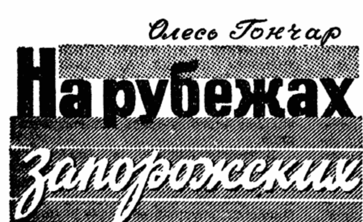
В номерах 1 и 2 журнала «Визма» опубликован новый роман Олега Гончара «Человек и оружие».

ное обсуждение представленных работ органами советской печати и широкой общественности. Комитет будет благодарен творческим и общественным организациям, учреждениям культуры и всем трудящимся, если они примут участие в обсуждении кандидатур, выдвинутых на соискание Ленинских премий, и выскажут свои отзывы, предложения и замечания на страницах печати либо в письмах в адрес Комитета (Москва, К-9, проезд Художественного театра, дом 3-а) до 31 марта т. г.